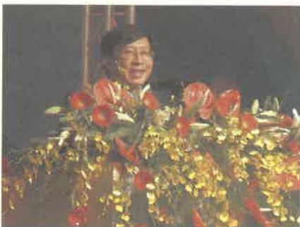
前行政院副院長劉兆玄教授蒞校專題演講