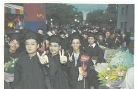
師生進入典禮會場