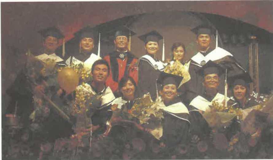
畢業生與校長合影

湯雞，衣服溼了也就算了，心都涼了一半，心中暗自揣測，明天不會也像今天一樣吧！早上萬里無雲，典禮正式開始卻傾盆大雨。不過事實證明，我們這一屆畢業生是幸運的，前幾天的雨只是老天爺的最後考驗，過了這一關，將來職場上便一切順遂。