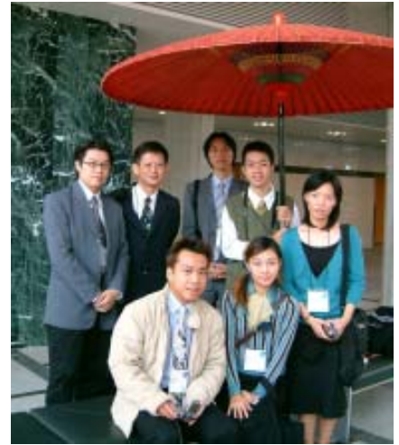
設計學院研究生參與研討會

2005 年 10 月將在我國舉辦第七屆亞洲設計研討會 (或許名稱會改成第一屆國際設計研討會 (IDC)；據設計學會理事長參與相關會議的轉述，ADC 是否改成 IDC 將於今年底確定；如果改成 IDC，在本校舉辦時，將是第一屆 IDC。)由