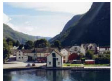
林日揚作品 - 挪威 / 松娜峽灣

各位喜愛藝術的朋友們，是否想在工作繁忙之餘，盡情徜徉在藝術與音樂的大海裡，仔細聆聽兩者結合的美妙樂章？歡迎前往欣賞蔡老師獨具風格的油畫作品，讓我們乾渴的心靈注入一股清泉！（張平，ext. 2608）