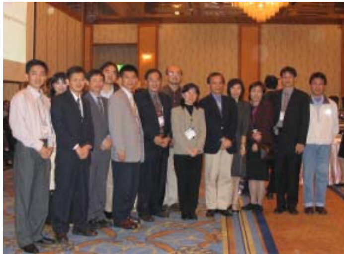
歡迎晚會上與會老師合影

亞洲設計研討會(Asian Design Conference, ADC)是結合亞洲各國產官學界代表的國際設計學術會議，目前為亞洲各國設計研究學者主要的發表園地及學術交流場合之一，也是亞洲向歐美各國發出設計資訊的主要管道。第六屆亞洲設計研討會於92年10月13日至17日假日本筑波市的國際會議中心舉行，由日本的设计學會、科學委員會與感性工學會承辦；參與的學術團體有中華民國設計學會(Chinese Institute of Design)、日本設計學會(Japan Society for Science of Design)、韓國設計學會(Korean Society of Design Science)及大陸高等設計教育聯盟(Chinese Federation of Senior Design Education)之外，英國的Design Research Society也加入本次研討會。開幕式大會特別邀請日本秋篠皇太子夫婦與當地縣市政府首長蒞臨現場致詞，使大會倍增光彩。