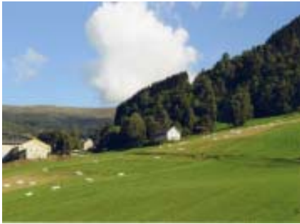
林日揚作品 - 挪威 / 佛詩