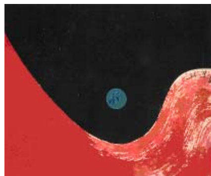
蕭勤大師作品－陰陽