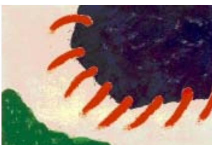
蕭勤大師作品－向無限昇華