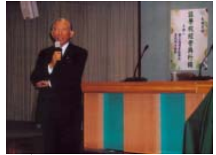
高雄餐旅學院李前校長福登蒞會演講

鼓勵老師努力在國際上發表研究成果。另外在招生不足的危機方面，我們必須增加競爭力，增加競爭力第一個行銷策略就是「提高知名度，增加國際化的能見度」。提升論文發表數必須從制度上改變，鼓勵老師研究發表，教學上有相對配套措施，甚至於用薪水額外的獎勵，讓老師覺得必須要自我提升，否則會被淘汰。