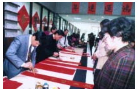
書法研習社舉辦現場揮毫活動