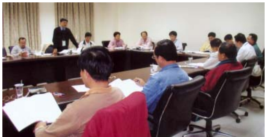
93年度主管共識營綜合座談

明「辦活動要隨時融入運用創意與行銷策略」的觀念。他說，某次全國大專運動會舉辦前，大家對台南家專都不認識，該校不僅選派學生參與運動競賽，並特別挑選學牌前導隊伍的學生，並精心設計學生出場時穿著的服裝，打扮得仿如古希臘奧林匹克運動會，而成爲運動場上最吸引注意力的焦點，當時的三家電視台爭相報導，一夕間該校就出名了，很多人都知道