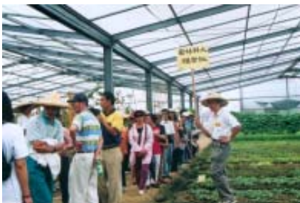
福智研習社參訪金品有機農場-1