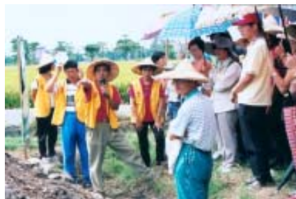
福智研習社參訪金品有機農場-2