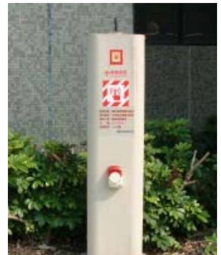
緊急求救壓扣系統裝置

有句廣告詞說「科技始自人性」，科技使人的互動更為快速，科技更可幫助知識作便利、快速的累積、分類、統計、查詢。校園安全是校園學生事務工作中非常重要的一環，若學校各項方案設計雖能使學生學習與發展臻於極致，但卻忽略了學生的校園安全工作，則前者的努力恐如豪華危樓，亮麗中潛伏著危險。(林朱蚶，ext. 2313)