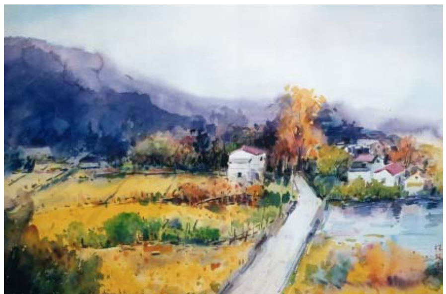
林政杰老師作品－田園