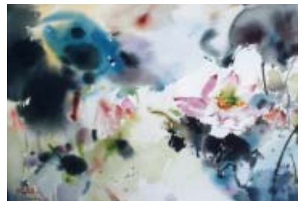
林政杰老師作品－夏荷