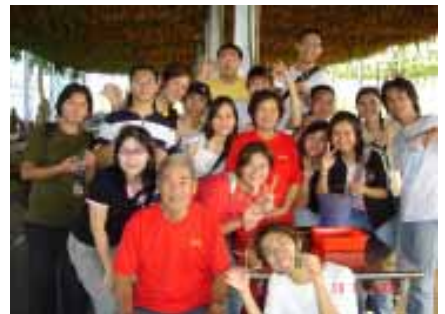
「匠師的故鄉」休閒園區

當日師生一行19人，在車上歡唱卡拉的歌聲伴隨下，不知不覺的來到了園區。經當地解說員深入介紹下，認識了河口的生態、濱海植物及潮落差5公尺驚人的景象。午餐享受了當地頗具特色的向日葵風味餐，下午親身體驗鄉村活動的焢地瓜窯、製作大甲芋頭酥、鄉下放牛小孩玩的林投童玩古吹及蘭草編織，同學們均是第一次體驗，玩的不亦樂乎。此行參訪活動，不但深刻學習台灣傳統文化，且讓參加的每位師生留下難忘的回憶。（吳富玉，ext. 2315）