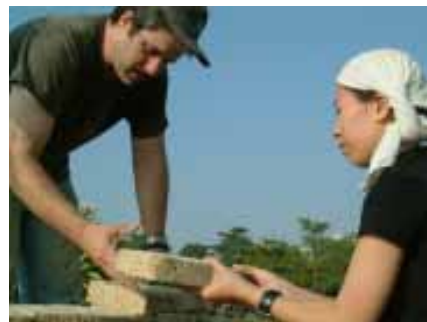
須按照磚塊上編號「A」~「Z」次序排列

這個作品是一個由磚石堆砌之五尺洞穴，磚石取材於自然界唾手可得之灰土與雜草，堆疊成穴後成了人們可以進駐徜徉的居所，展出期間參觀者可以進入「夢之穴」沈思入夢，並將過往的、現今的夢中影像塗繪於洞穴之中，在穴中可以作畫、塗抹、圓夢，作品可以與參觀者互動，觀看「夢之穴」的人同時也是「夢之穴」的共同創作者，他們入穴的身體記憶以及在穴中留下的彩繪記錄，這些夢、經驗與記