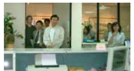
以英語導覽參觀行政大樓