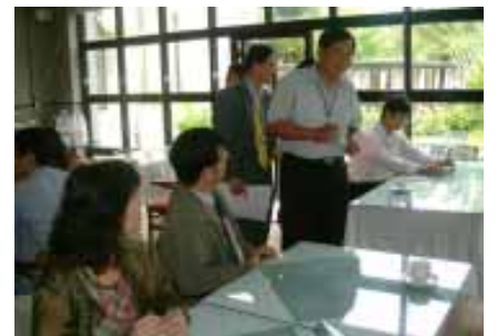
評審小組參觀本校英語學習園區