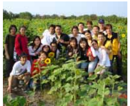
本校外籍學生校外文化參訪