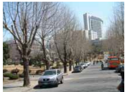
延世大學校園一隅