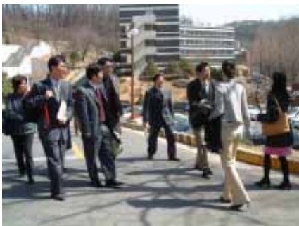
延世大學校園巡禮—校園幅員寬廣，樓宇與樓宇之間有山坡林園間隔

「2005年台灣高等教育韓國訪問團」在3月29日中午時分結束，整個留學博覽會及參訪行程順利且圓滿，傍晚隨即搭機返台。（顧理，ext. 2231）