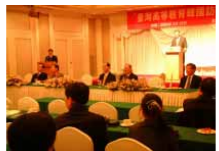
中央大學劉全生校長於記者招待會致詞