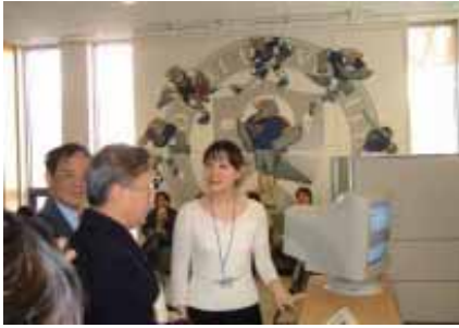
參觀延世大學校園