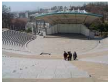
延世大學校園巡禮—環山而築的弧形階梯式露天音樂廳