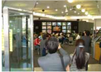
延世大學國際學習中心，以 15 個螢幕，同時播放著世界主要語言之重要頻道