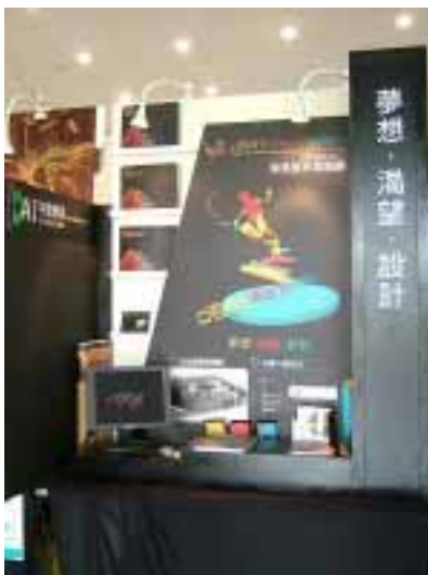
佳作—「視覺傳達設計系 2005 年畢業展形象設計」