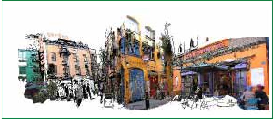
甲等—「經緯線上漫步」