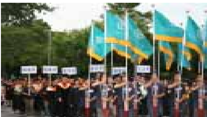
師長們陪同畢業同學校園巡禮