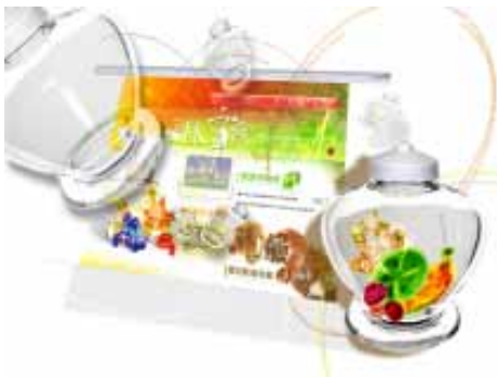
優等—「員林蜜餞博物館」