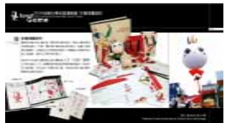
佳作—「2006 全國大專院校運動會—形象規劃設計」