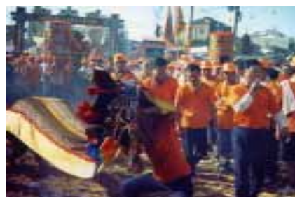
長平社區男舞獅陣—金獅

女獅隊方面，也許可以嘗試看看，創作舞獅以並非跳獅陣，而是拿獅陣的主題做新的表演，可以更換不同的獅頭和獅身，一開始可以來製圖，縫布料，縫成不同的顏色，媽媽和小朋友一起合作縫製獅身的衣服，演出分成兩個階段，一邊男生，一邊女生，分開上課。