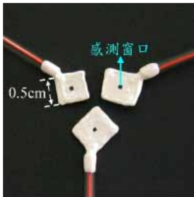
甲等—「以延伸式間極場效電晶體研究氣離子之量測」