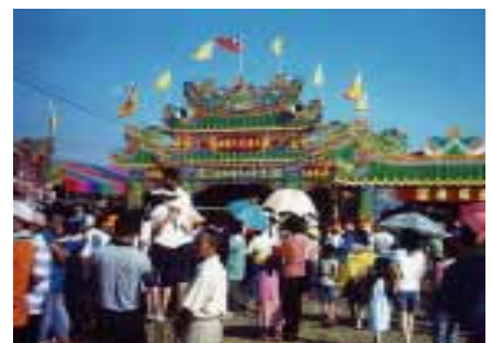
六房媽祖過爐是雲林縣每年宗教盛事