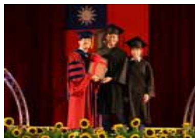
畢業同學獻紀念品