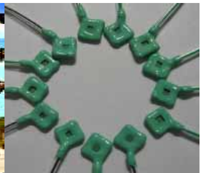
優等—「二氧化鈦延伸式間極感測場效電晶體應用於尿酸酵素生物感測器之量測與積體化前端檢測電路之研究」