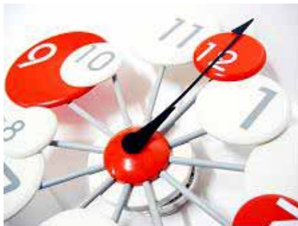
佳作—「休閒文化創意商品開發」