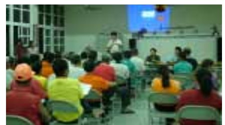
藝術中心引進藝術家進駐長平社區

這個計劃執行三個月後，將有成果演出，將有長平社區自己做的、縫的、畫的舞獅衣服、獅旗等，都將以全新的面貌呈現在大家的面前，希望大朋友，小朋友們共同來欣賞。（陳柏羽，ext. 2646）