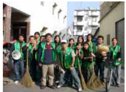
增加學生愛護環境及環保觀念

「Clean Up the World」此項社區活動意義深遠，一個小小動作就可以讓世界更美好，透過這樣的活動，讓學生親身體驗愛護環境及環保意識 (Reduce、Recycle、Reuse、Refuse) 的觀念。此外，本校勞作服務教育組也上網公告勞作生 6 W (Who、What、Why、How、Where、When) 宣導勞作服務教育理念 (網址為： http://www.yuntech.edu.tw/news/9408/94080103.doc )，倡導環境教育的重要性，以培養學生健全的人格及健康的行為。(江麗玉, ext. 2351)