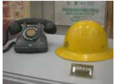
產業文物－加工或具特殊文化意義之物