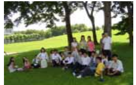
越南籍同學校園留影