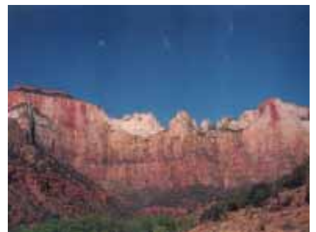
黃石公園景緻 - 1

隔日清晨我們搭車返回旅程的起點—加州。沿途車上 52 位共遊的夥伴大家都有一點依依不捨，相聚自是有緣，所以也彼此留下難忘的回憶，他日有緣還會再相聚，大伙彼此互道珍重再見！我們回到加州已是傍晚，告訴美國朋友這次的旅程中的點滴有多麼的豐富，一起分享旅行的美好與快樂！翌日，預計搭下午三點五十五分的飛機由洛杉磯返回台灣，趁上午的空檔美國的朋友又帶我們搭公車到附近的海灘散步，天氣涼涼的，微風徐徐吹來，感覺很舒服，有人在沙灘上作砂畫、有人釣魚、有人騎腳踏車，日子過的很清閒，心情輕鬆平靜！美麗的沙灘上留有我們的足跡，「再見！美國洛杉磯」，一切的回憶將是永遠美好的！（江麗玉，ext. 2351）