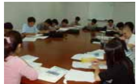
越南籍同學暑期研習情形