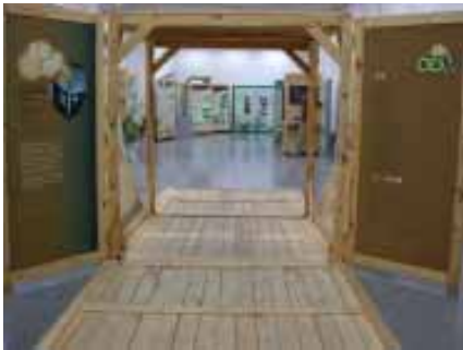
展開產業歷史的寶盒