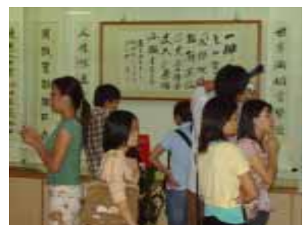
參觀雲林縣文化局書法展

這27位學生不只在學業上用心，在許多活動中更展現了他們活潑主動的個性，相信在他們生動的話劇、優美的歌聲及動容的演講中我們就能深受感動。