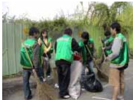
培養學生服務精神

本校正式實施勞作服務教育已屆滿一年，據勞作服務大隊長表示由於跨系修勞作服務教育，所以結交不少好朋友，這就是大學課程中最難忘的經驗。為進一步擴展勞作教育與好鄰居文教基金會共同攜手合作舉辦「清潔地球，環保台灣」，9/14上午10時，一千多名本校學生齊聚在人文公園，引起許多路人好奇，後來看到同學們