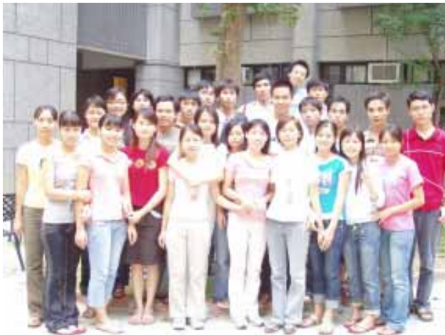
就讀本校企管系越南籍同學校園留影

發行人：林聰明 出版者：國立雲林科技大學 編輯：雲聲編輯委員會 主任委員：陳俊宏 總編輯：顧理 執行編輯：高懿貞 電話：(05) 534-2601 傳真：(05) 532-1719 校址：64002 雲林縣斗六市 大學路3段123號 網址：www.yuntech.edu.tw /~aax/index.htm E-mail：aax@yuntech.edu.tw (本刊物響應環保選用再生紙印刷)