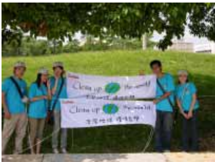
「Clean Up the World」活動意義深遠

三、產業建築與土木設施：指產業工作需求所營建之建造物，包含因居住、信仰、生產、商業、交通、防禦、休憩、娛樂、政治、教育、教育福利、紀念喪葬等緣由所興建者。