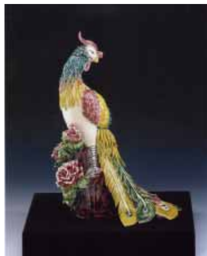
葉星佑老師作品 - 鳳凰

除了傳統故事典故題材之外，在花、鳥、人物、宗教故事創作方面也具巧思，以纖細的手法和鮮豔又具清新的用色特質，更凸顯葉老師個人的創作風格，並且葉老師積極將交趾陶藝術，運用在廟宇與古蹟修護上，如先後完成的台中文昌廟、張家