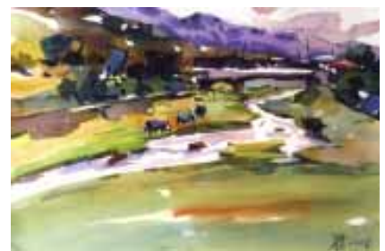
陳文龍老師作品 - 風景

台灣鄉土風情水彩畫展，展出日期為94年11月22日至12月13日，展出地點於藝術中心展覽大廳。(陳柏羽, ext. 2646)