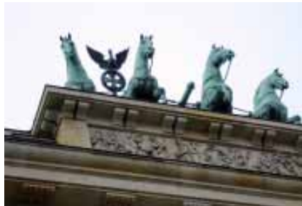
柏林地標布蘭登堡城門