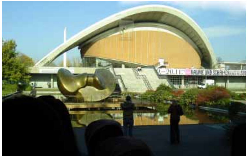
21屆柏林短片影展於柏林市中心文化宮(Haus der Kulturen der Welt)揭幕

影片區隔為大會競賽劇情片、大會競賽紀錄片、數位片、歐洲片、亞洲片、KuKi兒童片等單元。我國計有送賽片11部，入選放映片4部，入圍競賽劇情片2部。獲得放映的影片分別為「剪單」(Single Paper)(入圍競賽劇情片 & 數位夢境放映)、「方塊悲劇」(Cubic Tragedy)(入圍競賽劇情片 & 數位夢境 & 亞洲動畫片放映)、「偶素雞」(Amy Talk Show)(亞洲動畫片放映)、「行動鼠」(Walking