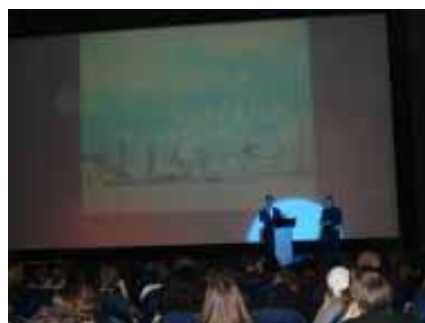
21屆柏林短片影展頒獎典禮情形