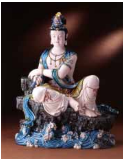
葉星佑老師作品 - 觀音