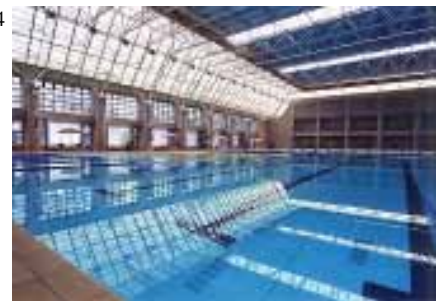
1, 2, 3, 4 本校所展現出的運動活力及良好的硬體設備