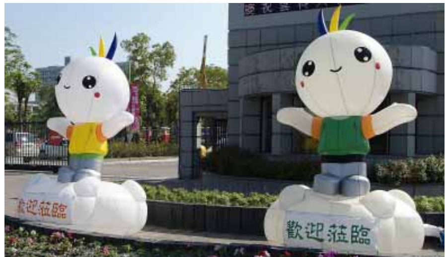
2006 全國大專校院運動會吉祥物 - 雲寶寶