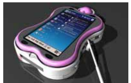
專屬女性上班族的數位包包-2

作者對自己設計的一段話：學習如逆水行，舟不進則退，所以要時常告誡自己「不要在金字塔裡作設計」。(陳柏羽整理, ext. 2646)