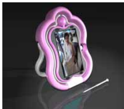
專屬女性上班族的數位包包-1