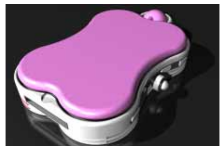
專屬女性上班族的數位包包-3