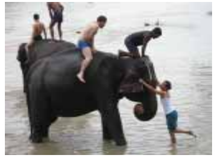
想爬上大象背上可不容易

中午時分搭乘尼泊爾的小飛機前往奇旺國家公園，感覺像是搭飛機來到非洲叢林，下飛機後再轉搭船隻划船深入奇旺國家公園，下午時分我們看大象洗澡，走到河邊，突然間有 3、4 頭大象從森林中走出來，原住民坐在大象上頭，他們用特殊的語言在指揮著大象，有一對西班牙的朋友一同上去幫大象洗澡，男生從大象的長長鼻子爬上象背，當女生正要爬上去時，調皮的大象卻鬧起脾氣來，使盡招術不讓女主角爬上，還是原住民厲害，說了幾句聽不懂的語言，女主角終於爬到大象背上，