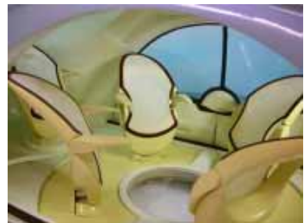
flying / 指導老師：工設系葉博雄