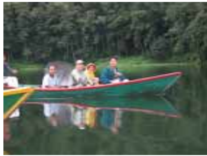
由木棉樹所製一體成形的獨木舟

們一群人坐在河邊看夕陽，喝飲料閒話家常，直到天色昏暗才返回飯店用餐，晚餐品嚐道地的尼泊爾風味餐，隨後也欣賞Tharu Stick Dance 民俗舞蹈表演；此舞蹈源自於持木棍攻擊敵人或嚇阻猛獸，之後演變成傳統的民族舞蹈，高亢激昂的節奏韻律，讓人深刻感受到尼泊爾既濃厚又豐富的文化色彩。