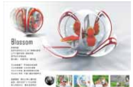
紅貝殼 / 指導老師：工設系陳鵬仁