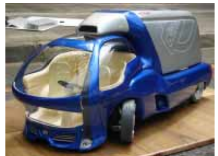
S&L / 指導老師：工設系林勝吉