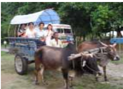
搭牛車前往塔魯(Tharu)農村部落

次日清晨我們搭牛車深入瞭解尼泊爾的塔魯(Tharu)農村部落，在這裡的居民是以農為主，到處可以望見綠油油的稻田，一望無際，人們看起來都相當的純樸善良，在他們的跟裡我們就像外星人，同團旅遊的團員(聖誕老婆婆)帶了許多糖果餅乾，發送給農村部落的小朋友，從他們的眼神中，我彷彿看見這裡物資的嚴重缺乏，孩童天真興奮的眼神，他們滿心的感激和驚奇，幾乎全村部落的小孩全部跑過來，有一個姐姐好不容易從中拿到糖果，卻捨不得吃，留著分給弟弟吃，真令人不捨與感動。在發送糖果的過程中讓人明顯領悟到「施與受」的幸福和喜悅。傍晚我