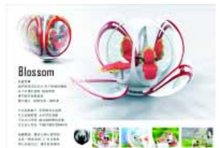
造型設計組銀賞獎作品「紅貝殼」

亦不曾被提及。而另一隊優選的「公路殺手剋星」提出了創新的超音波技術去驅離誤闖公路的動物，並結合所有傳統喇叭的功能，改變了汽車一百多年來對車上喇叭的單一印象。另外值得一提的是，本次車用電子這兩隊，是大四學長與大三學弟互助合作的具體展現。他們分屬不同指導老師，但在同一個實驗室設計且完成作品，期間他們互相討論腦力激盪、相互合作，才有此佳績。(陳鵬仁，楊博惠，ext. 6120, 4340)