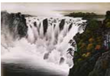
葛憲能大師作品－濤聲