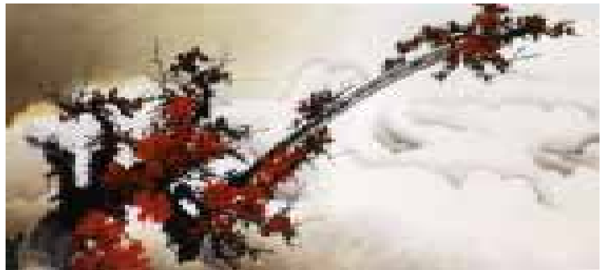
葛憲能大師作品－踏雪賞梅