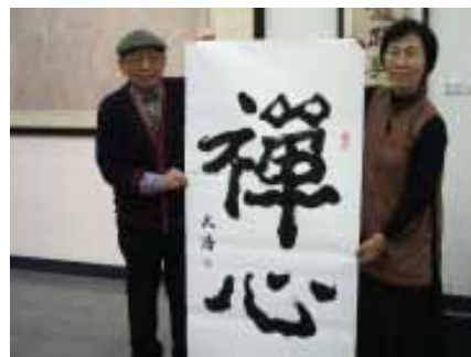
追求「禪」的生活藝術