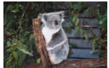
無尾熊屬夜行性動物