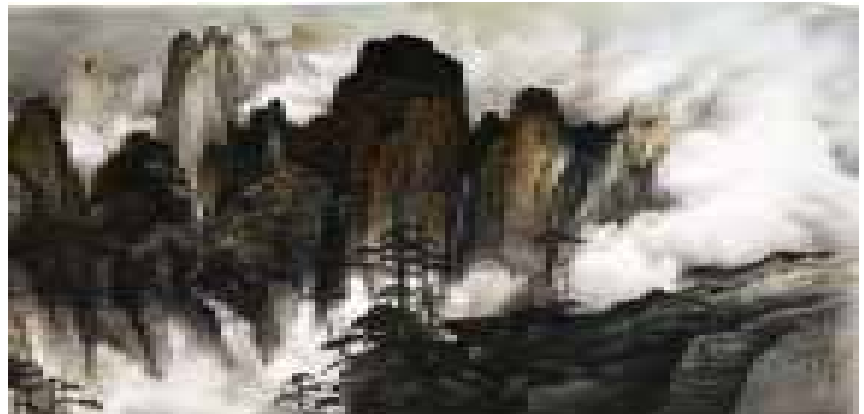
葛憲能大師作品－松