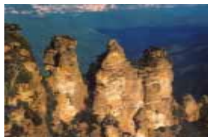
澳洲藍山國家公園 - 三姐妹岩