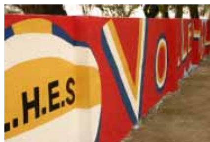
以排球為構想主題的牆面

創作過程中視傳系同學與六合國小活潑的小朋友們玩在一起，享受於多彩的顏色中，揮灑童年的快樂時光，六合國小老師們也熱心的共同參與，設計地面上的排球隊隊徽，完成大牆面的校園作品之後，每個人都很有成就感，紛紛邀其他小朋友來欣賞，也待有興趣的朋友們經過六合國小時，能進入該校參觀，感受一下充滿童趣的校園足球彩繪吧！