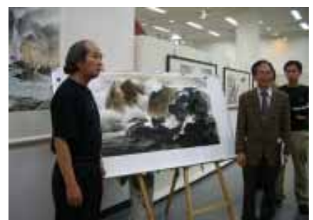
葛憲能大師現場揮毫作品