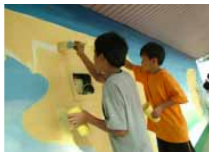
揮灑童年的快樂時光