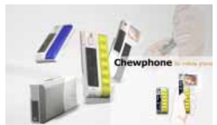
工設系張瀚禧同學參賽作品—造型設計組第 2 名