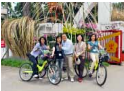
東勢林場生態之旅 - 騎鐵馬

在中部梨山地區曾發現有小斑豹斑夾蝶，1964年楊氏亦於青康藏高原採集到淺色小斑豹斑夾蝶，其已成為世界上稀有的蝶