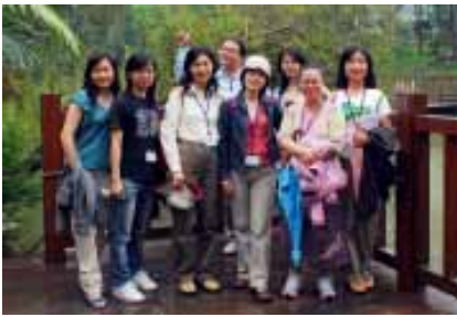
東勢林場生態之旅