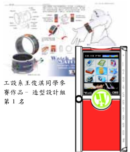
工設系王俊淇同學參賽作品—造型設計組第 1 名

中原大學與經濟部商業司、首機網路公司、台灣固網公司等單位合作，第 1 屆中原大學「挑戰創意、夢想加值—手機創意發明競賽」，係希望激發學生的無限創意並運用在行動電話新的應用服務。本項競賽分為應用服務創意與造型設計 2 組主題，參加對象為全國各大專院校學生，各項主題前 3 名可分別獲頒新台幣 3 萬元、2 萬元及 1 萬元獎學金，得獎作品經中原大學評估具有專利化可能性者，更可獲中原大學補助 50% 之專利申請費用（包括規費及事務所服務費）並協助將創意變為專利。本校工業設計系研究生王俊淇、張瀚禧同學參加本項設計競賽勇奪造型設計組第 1 名、第 2 名，鍾毓珊、張俊元、張聖德、江名哲等同學亦榮獲佳作，成績輝煌。（游麗媚，ext. 6101）