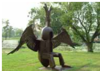
王松冠藝術家作品