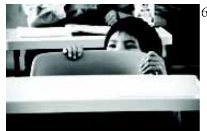
3. 紀錄影片作品 - 迷箱