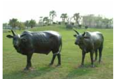
鄧廉懷藝術家作品