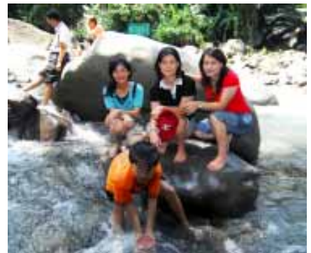
達娜依谷 魚賞魚區

的生乳均交由「光泉鮮乳」加工包裝後讓消費者飲用；「綠盈牧場」在92年並獲得全國牧場評鑑最高榮譽—5顆梅花獎。「綠盈牧場」或可是您假日踏青的選擇之一。(高懿貞, ext. 2235)