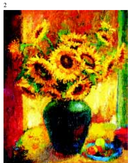
1. 下弦月 2. 你是生命中的太陽