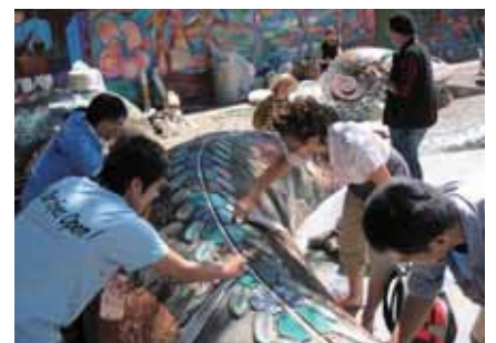
日本志工及舊金山學生一起參與壁畫創作