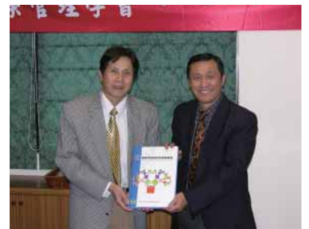
游副校長代表接受學會贈書