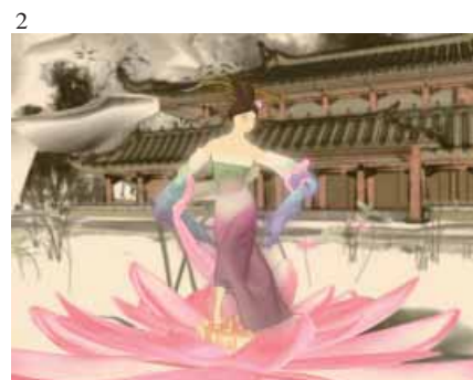
1. 2. 「花神」動畫作品 3. 4. 5. 「真愛」動畫作品