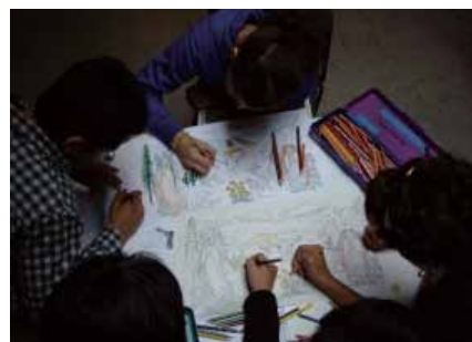
畫下心目中的加州意象