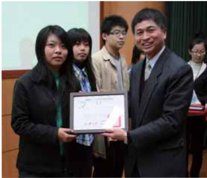
張國保司長親自頒獎表揚優秀創作