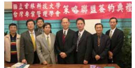
本校與「台灣專案管理學會」策略聯盟簽約合影

角落都受到承認，無形之中也拓寬了學生往後的發展途徑。因此這樣的策略聯盟，將來受益最大的會是學生和產業界。(許茗貴, ext. 5201)